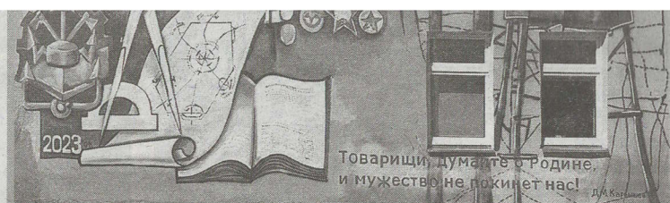
Мурал генерала-инженера Дмитрия Карбышева создали в школе №15 города Гродно имени Карбышева. Его разместили на стене здания школьного музея, посвященного жизни и военным подвигам генерала-строителя.

Рабочие дни Дмитрия Михайловича были заполнены до предела. Он лично объезжал опорные пункты, проверял сделанную работу, секторы обстрела и маскировку. Полководец держал свою линию перед инжене-